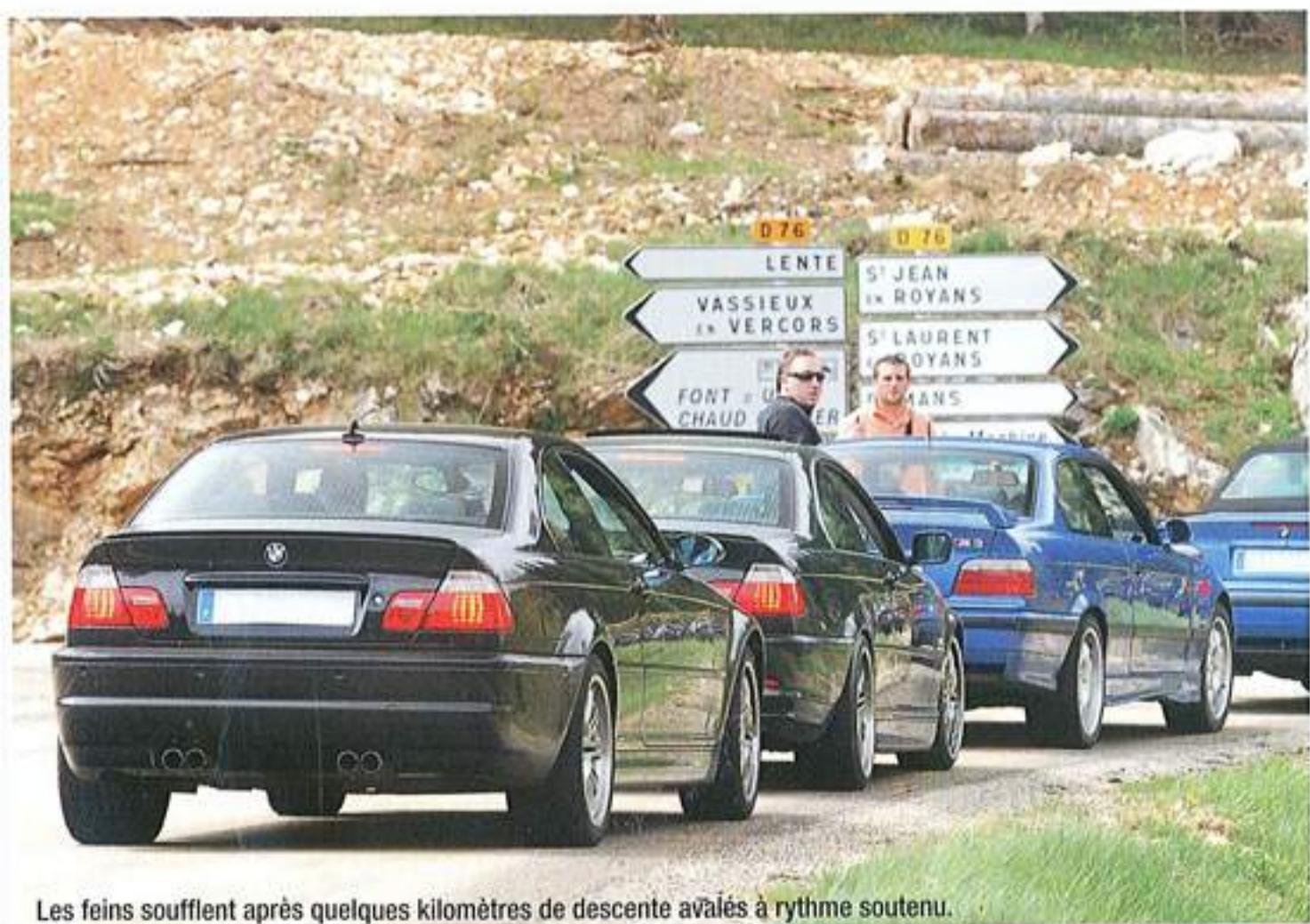
Les feins soufflent après quelques kilomètres de descente avalés à rythme soutenu.

14 h, c'est reparti ! Une fois le (bon) repas achevé, il n'a pas fallu longtemps à chacun pour se retrouver au volant de sa BMW M. Une balade (menée à un rythme parfois trop optimiste) a été mise en place avec un retour au restaurant pour récupérer une partie du groupe qui préférerait rester sur place pour discuter, profiter du cadre et avoir la surprise d'accueillir les membres du club Peugeot 201 qui organisait un rallye dans la région. Les discussions se sont alors engagées