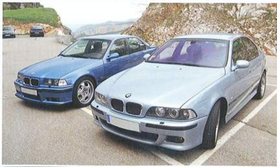
La M5 de l'organisateur, à côté d'une autre berline, mais M3 cette fois et qui reçoit de beaux freins bien utiles pendant la ballade.

pour l'auteur de ces lignes, ça part mal. En effet, la 120d est logiquement la dernière de la série (c'est une sortie M !) et avec deux camarades d'infortune, retardés par la circulation, nous perdons le groupe au détour d'un sens giratoire. Quelques appels plus tard et une reprogrammation de GPS, nous retrouvons le groupe au res-