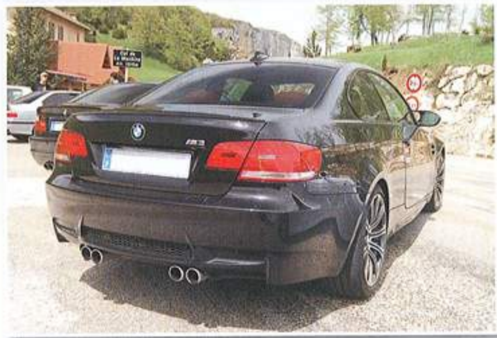
C'est indiqué sur le panneau ! Mais de ces trois générations de M3...devinez laquelle fut la plus efficace sur ces petites routes du Vercors ?

taurant, en haut du col de la Machine. Les petites routes empruntées pour y accéder nous ont mis en appétit aussi bien d'un point de vue gastronomique que «automobilistique», car c'est un vrai plaisir de conduire en profitant d'une telle vue mais aussi d'autant de petits virages à négocier. Au cours du repas, nous apprendrons que toutes les routes de l'après-midi seront de ce type !