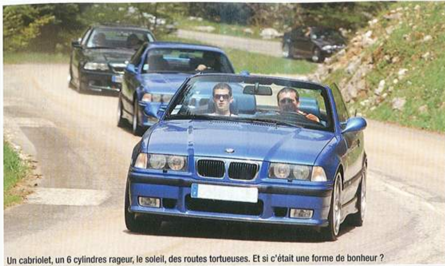
Un cabriolet, un 6 cylindres rageur, le soleil, des routes tortueuses. Et si c'était une forme de bonheur ?

entre passionnés, permettant de voir que le plaisir automobile peut revêtir plusieurs formes. Restaurer pendant cinq ans une voiture dont on a récupéré une épave et pouvoir profiter du plaisir de conduire qu'elle peut offrir du haut de ces vingt chevaux en est une façon. Le retour du petit groupe a donné le départ de la grande balade. Si vous ne connaissez pas le Vercors, je ne saurais trop vous conseiller de vous y rendre. Le site est extraordinaire et les paysages sont à couper le souffle, vertigineux. Par endroit, les BMW M ont posé pour la postérité, les conducteurs ont pu souffler car au total, la balade comptera près de 200 kilomètres ■