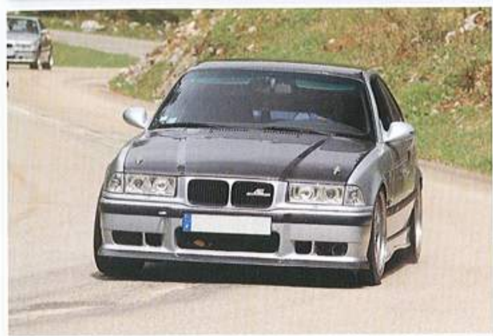
Freins, amortisseurs, boîte à air, allègement, carbone...Voilà une pistarde lâchée sur route ouverte.

entre passionnés, permettant de voir que le plaisir automobile peut revêtir plusieurs formes. Restaurer pendant cinq ans une voiture dont on a récupéré une épave et pouvoir profiter du plaisir de conduire qu'elle peut offrir du haut de ces vingt chevaux en est une façon. Le retour du petit groupe a donné le départ de la grande balade. Si vous ne connaissez pas le Vercors, je ne saurais trop vous conseiller de vous y rendre. Le site est extraordinaire et les paysages sont à couper le souffle, vertigineux. Par endroit, les BMW M ont posé pour la postérité, les conducteurs ont pu souffler car au total, la balade comptera près de 200 kilomètres ■